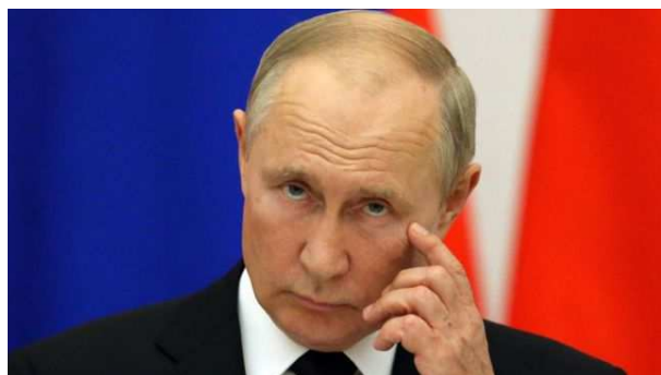
Vladimir Poutine

Depuis le début du mois de février, la tension est montée d'un cran à la frontière entre la Russie et l'Ukraine et ce, notamment en raison d'un exercice opérationnel conjoint des forces armées de la Biélorussie et de la Russie qui a débuté le 10 février 2022, mais il faut savoir que la Russie avait commencé un déploiement militaire massif le long de la frontière ukrainienne dès le mois de novembre 2021.